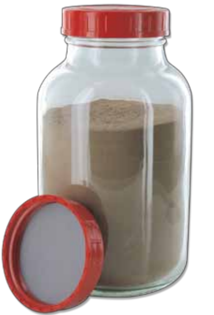
RK 1000 GT