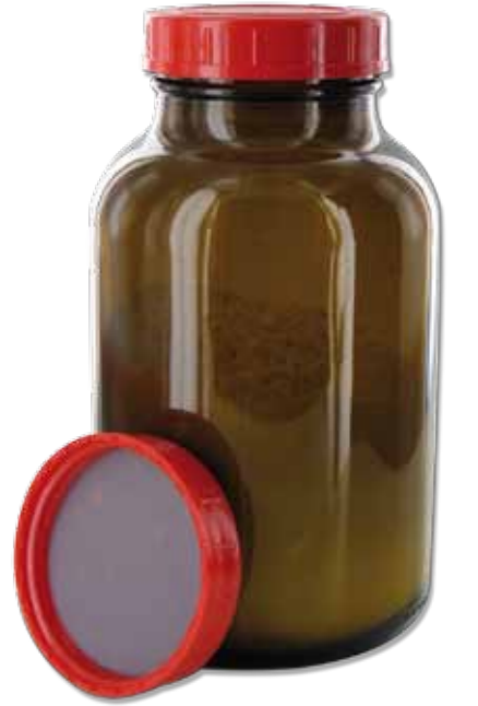
RB 1000 GT