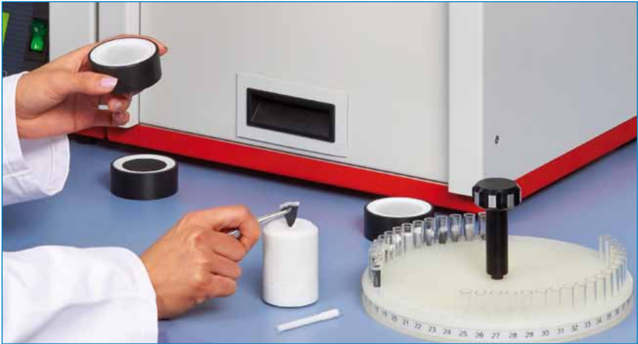
Einfache Überführung der Membranfilter in spezielle Glascontainer