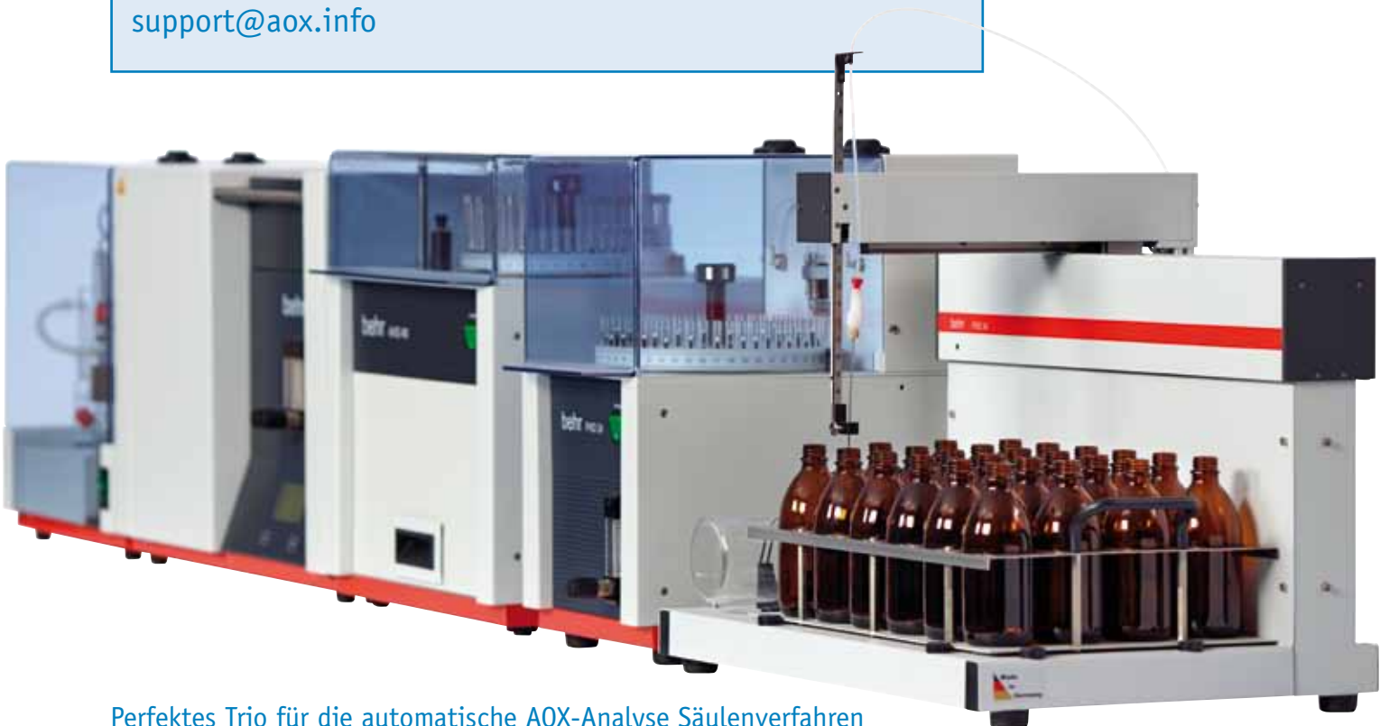
Perfektes Trio für die automatische AOX-Analyse Säulenverfahren