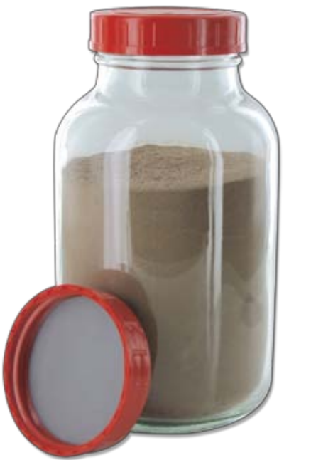
RK 1000 GT