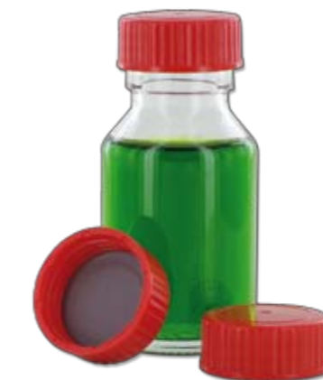
NK 50 GT