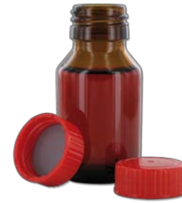
NB 50 GT