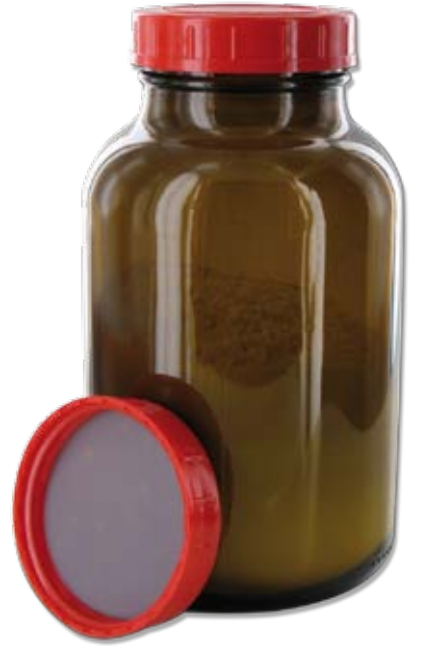
RB 1000 GT