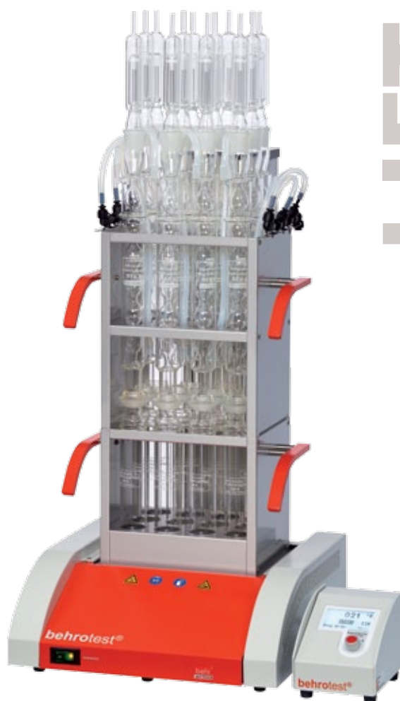
CSB/SMA 12 L