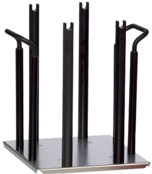
TS 12 SM