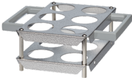
SG 6 B