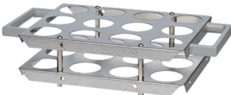
SG 12 B